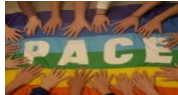
„Der Mensch wird am Du zum Ich“ M. Buber